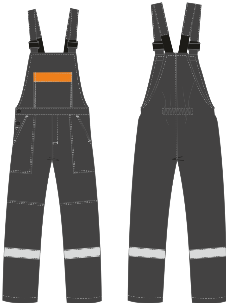
Рис. 2. Эскиз Костюм Легион-2 СОП т.серый/оранжевый, вид спереди и сзади.