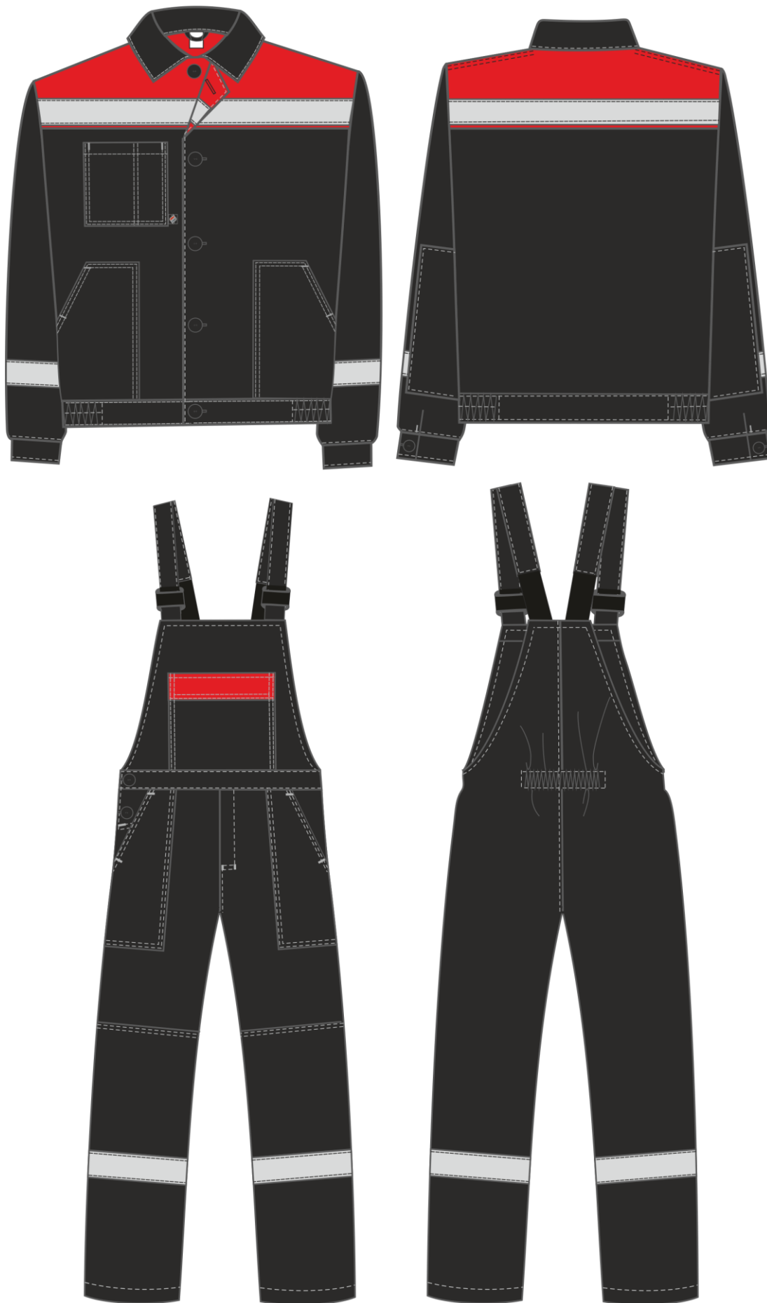
Рис. 6. Эскиз Костюм Легион-2 СОП черный/красный, вид спереди и сзади.