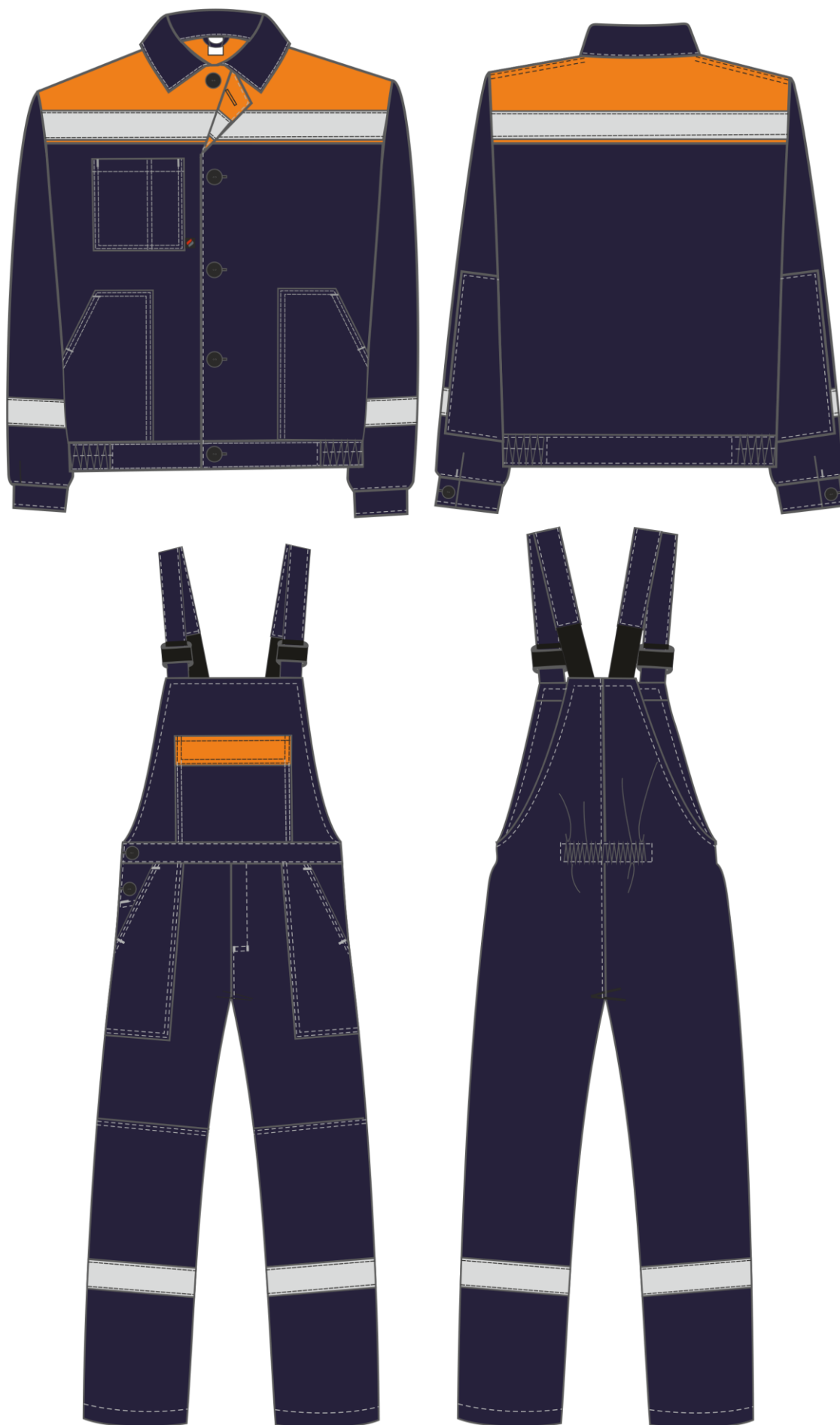
Рис. 4. Эскиз Костюм Легион-2 СОП т.синий/оранжевый, вид спереди и сзади.