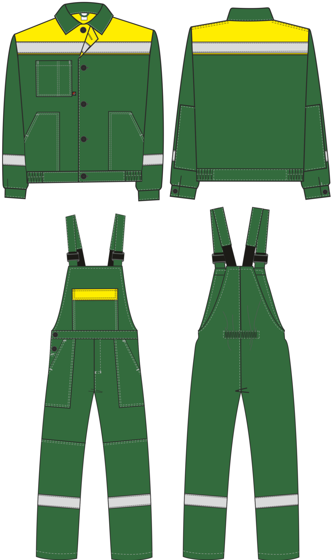
Рис. 1. Эскиз Костюм Легион-2 СОП зеленый/желтый, вид спереди и сзади.