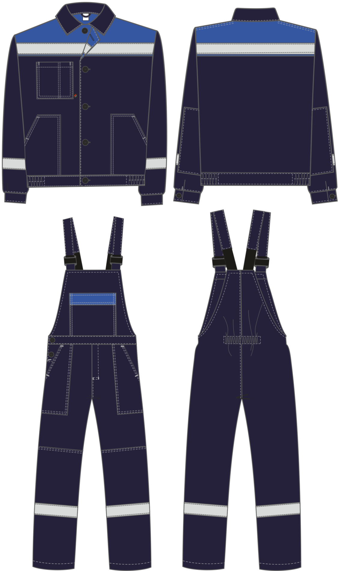
Рис. 3. Эскиз Костюм Легион-2 СОП т.синий/васильковый, вид спереди и сзади.