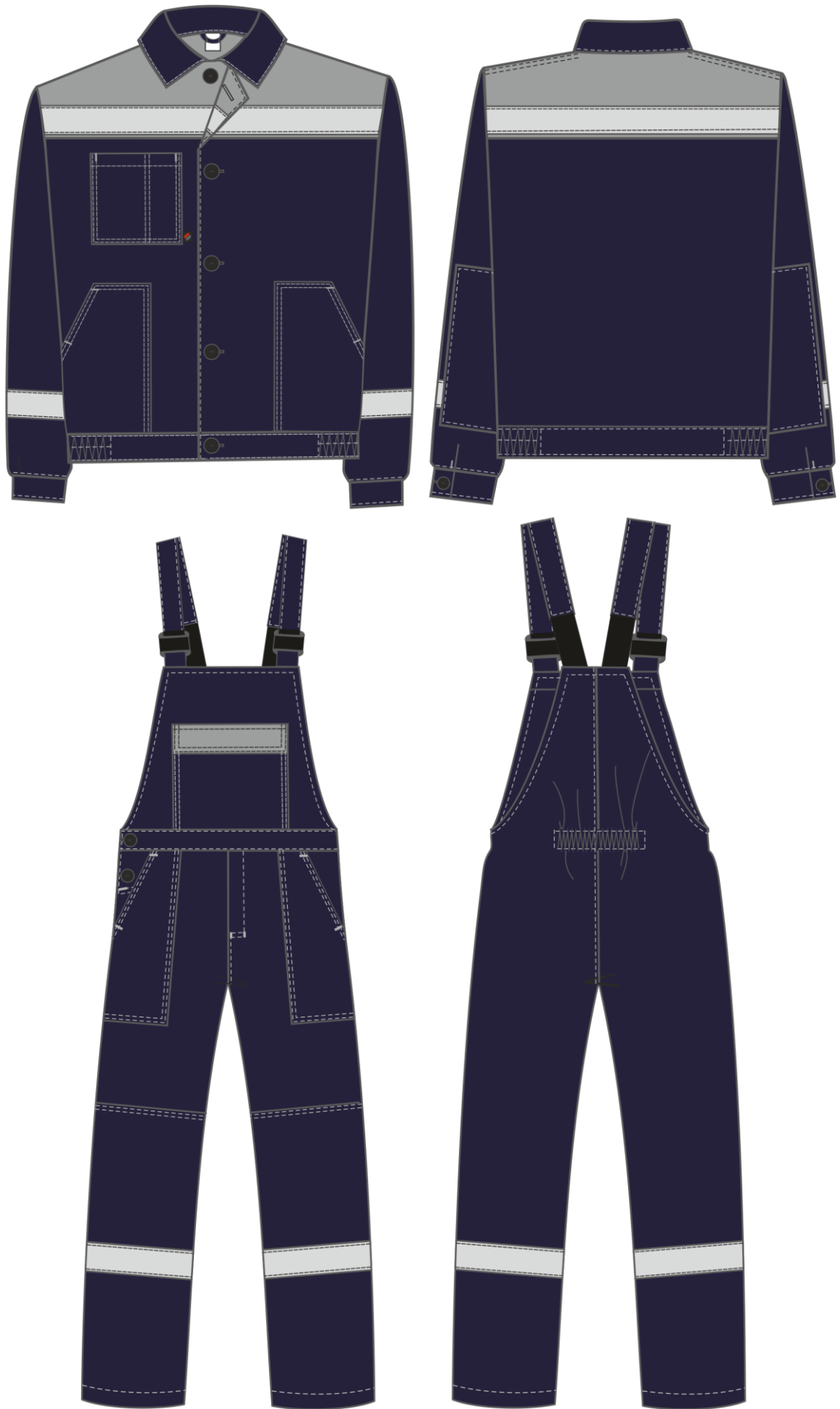
Рис. 5. Эскиз Костюм Легион-2 СОП т.синий/серый, вид спереди и сзади.